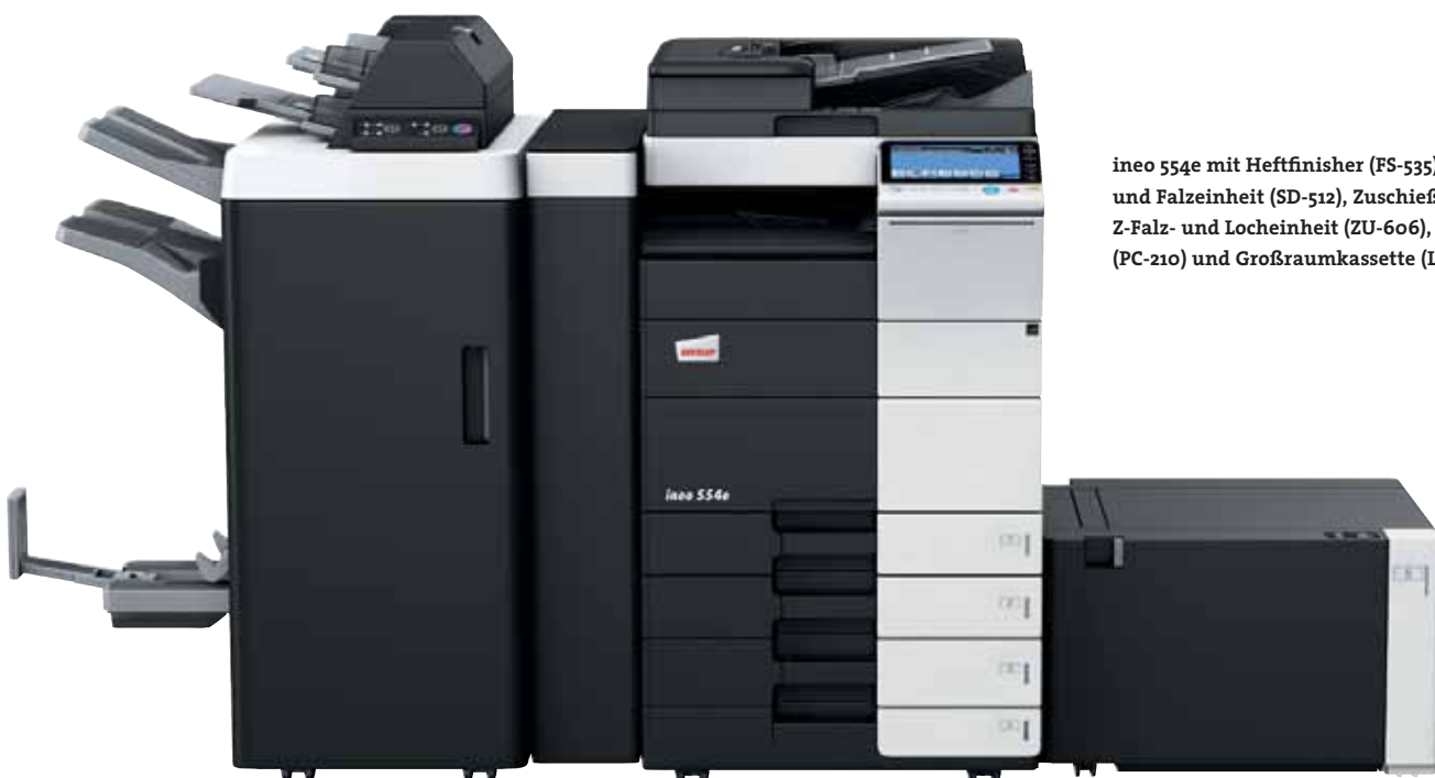
ineo 554e mit Heftfinisher (FS-535), Heft- und Falzeinheit (SD-512), Zuschießeinheit (PI-505), Z-Falz- und Locheinheit (ZU-606), Papierkassette (PC-210) und Großraumkassette (LU-204)

Jedes dieser Multifunktionssysteme – ineo 224e, ineo 284e, ineo 364e, ineo 454e und ineo 554e – ist einfach zu bedienen und hat eine große Bandbreite zusätzlicher Funktionen, die die tägliche Arbeit im Büro entscheidend erleichtern. Wenn beim Drucken, Kopieren und Scannen Zeit gespart wird, bleibt mehr Zeit für die eigentlichen Kernaufgaben – und das steigert die Produktivität im Büro.