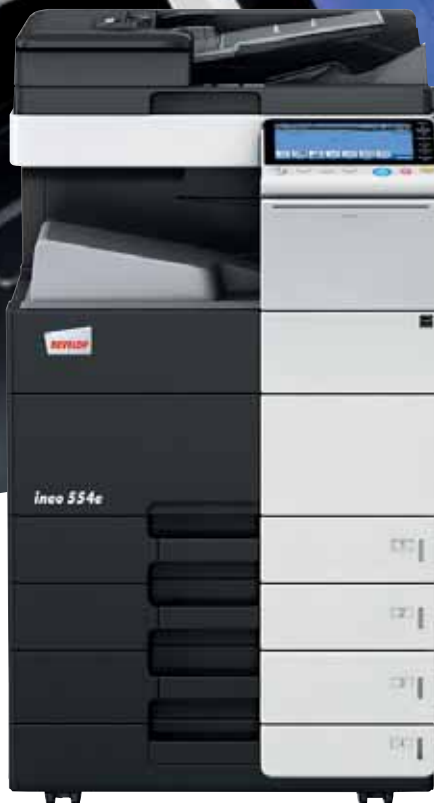
ineo 554e mit Papierkassette (PC-210), Ablagetisch (WT-506) und Ausgabefach (OT-506)